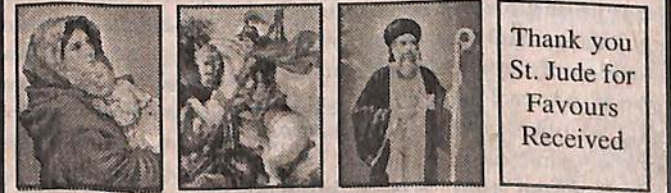
Thank you St. Jude for Favours Received